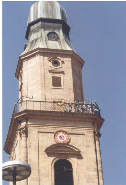
Besteigung der Hugenottenkirche

Trotzdem kam das Thema gemeinsame Kultur nicht zu kurz. Der Partnerschaftskreis aus Eckental arrangierte für seine erwachsenen Gästen aus Ambazac eine Stadtführung durch Erlangen, mit dem Motto „Auf den Spuren der Hugenotten“. Die Führung zeigte auf, wie unsere Vorfahren mit dem Thema der Integration von „Fremden“ umgingen und es letztendlich zum Wohle aller bewältigten. Ein Beispiel für unsere heutige Zeit, die gleiche Probleme zu bewältigen hat.